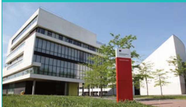
Faculté de Droit - Paris-Est Créteil Site André Boulle 83-85 av. du Général de Gaulle 94000 CRÉTEIL

Correspondant informatique et libertés (CIL) d'une grande entreprise, Juriste Internet, Expert juridique en technologie numérique, Avocat en droit des nouvelles technologies.